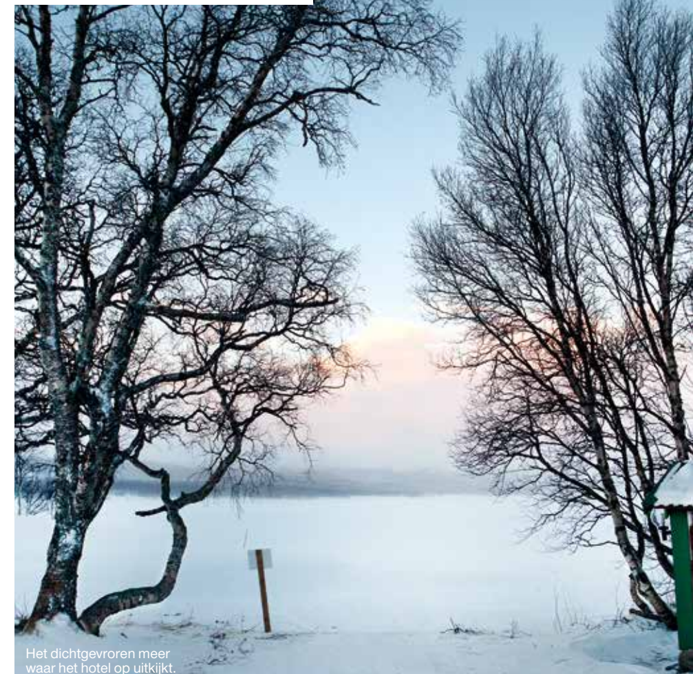
Het dichtgevroren meer waar het hotel op uitkijkt.

We eten MALS RENDIERVLEES en zalm met hazelnoten