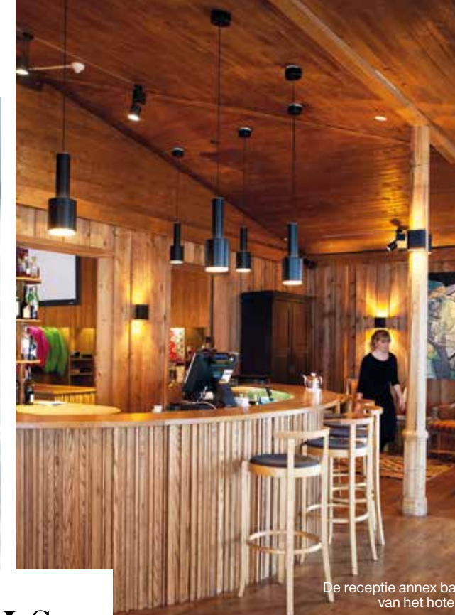
De receptie annex bar van het hotel.

We eten MALS RENDIERVLEES en zalm met hazelnoten