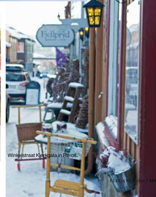
Winkelstraat Kjerkgata in Røros.